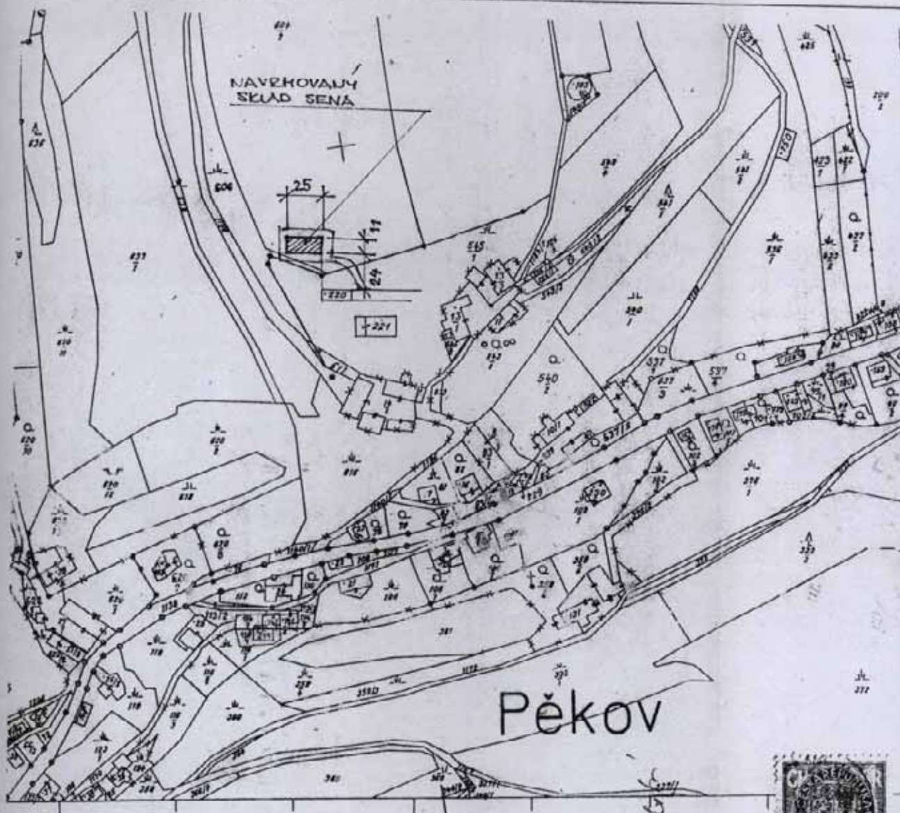
SITUACE ŠIRŠÍCH VZTAHŮ 1:2880